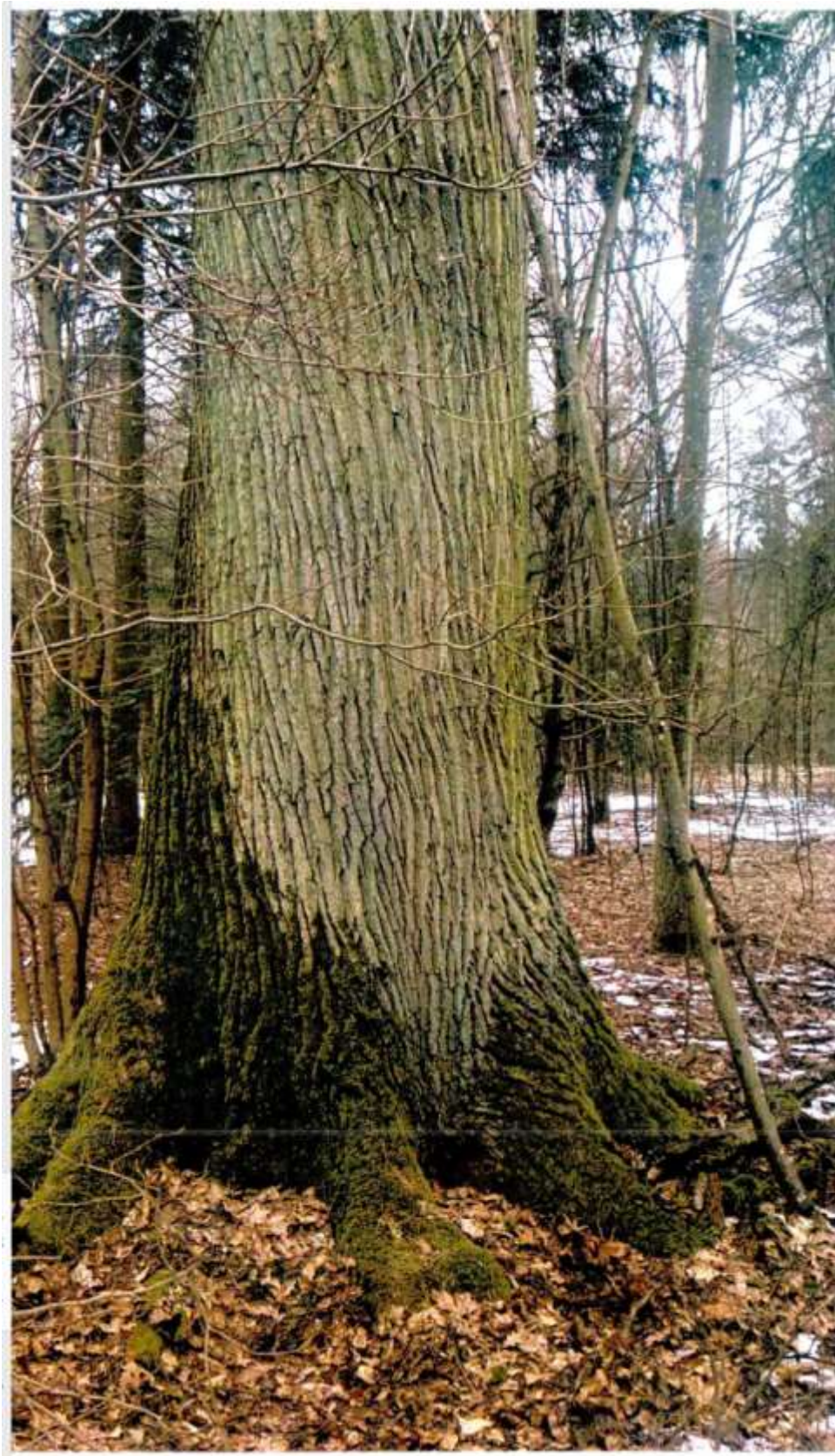
Fot. 1. dąb szypułkowy